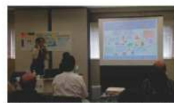
ワークショップの様子 (区民企画協働事業)