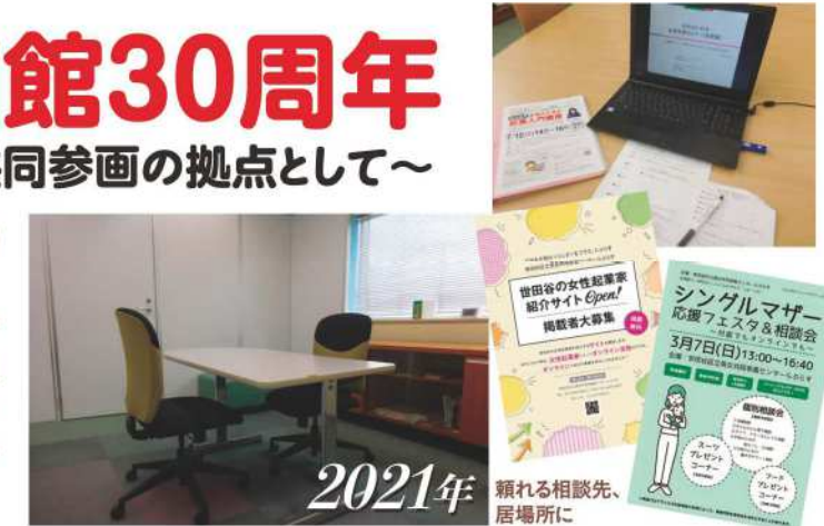
2021年 頼れる相談先、居場所

世田谷区立男女共同参画センターらぶらすは2021年2月2日、開館30周年を迎えました。1991年に下北沢の北沢タウンホールでオープンし、2016年に三軒茶屋に移転してからも、らぶらす(la place)は、だれもが自分らしく豊かに生きることができる男女共同参画社会を目指して、人々が活動・交流するための「ひろば」です。これからもこの「ひろば」が皆さんの出会い、学び、活動の「プラス」になるよう、努めてまいります。