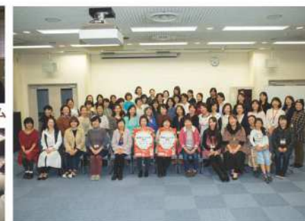
女性起業家が大集合! 起業ミニメッセ