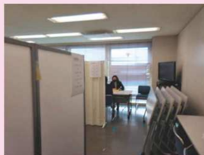
弁護士相談、働き方サポート相談など5種類の相談を無料で実施

2021年3月7日(日)、「シングルマザー応援フェスタ&相談会～対面でもオンラインでも～」が開催され、24人のシングルマザー、プレシングルマザーが来場されました。新型コロナウイルス感染症拡大防止のため、「個別相談会」「スーツプレゼントコーナー」「フードプレゼントコーナー」のみ実施。どの企画も大好評で、予約やお問い合わせが100件近くになったため、急遽フードの配布数を増やし、配布期間も延長しました。参加者の動向からも、会場アンケートからも、収入の減少や別居など、シングルマザーとその子どもを取り巻く状況が厳しくなっていることがうかがわれます。らぶらすでは今後も、各種相談、居場所などで、シングルマザーをサポートしていきます。