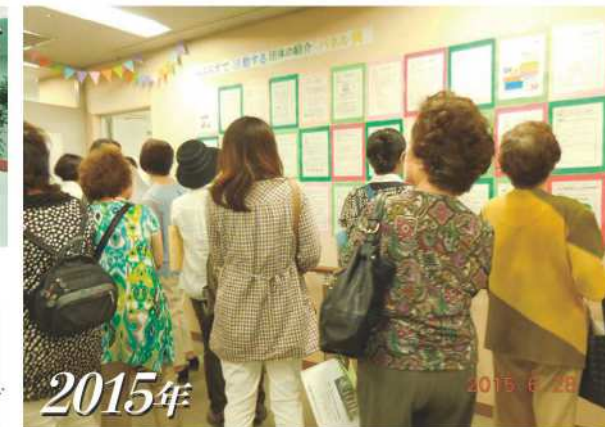
2015年 下北沢時代のらぶらすフェスタ。らぶらす登録団体の紹介パネル展