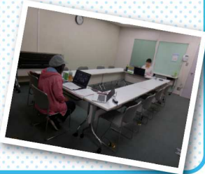
進行役の起業家女子部イヴのメンバーとらぶらすスタッフ。

らぶらす女性起業家交流会 オンライン上で目を引くキャッチコピーや、オンライン販売についてのミニレクチャーと、意見交換会の2部構成でおこないました。新型コロナウイルスの影響で約半年ぶりの開催。久々の再会に参加者は大盛り上がりでした。小さなお子さんを持つ参加者からは、「オンラインだったから参加できた」という声もいただきました。