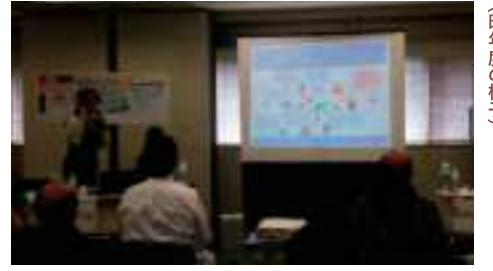
パネルディスカッション(昨年度の様子)