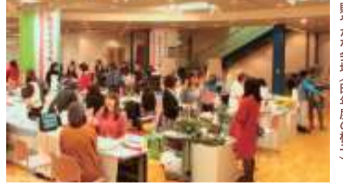
お客様と出展者で華やかな会場(昨年度の様子)