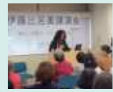
講演会「あたしの語る、コトバとココロ。~女が語るということ」

らぶらすでは6月29日(日)、「らぶらすフェスタ」を開催し、区民・グループ・団体の皆さんと交流を深めました。詩人伊藤比呂美さんを講師にお迎えした講演会は、エネルギーあふれるライブながら、唯一無二の人生を生きてこられたその声・語り・パワーは、みなさんへの熱いエールとなったようです。カフェコンサートは、名曲の数々を自在に奏でるバイオリンとギター演奏に大いに盛り上がり、女性起業家によるスウィーツも大好評。およそ350の方が来場されました。