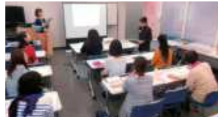
事業について取組みや 悩みを語り合います

らぶらす女性起業家交流会は、起業女子部・イヴの木(起業ミニメッセ出展経験者による団体)とらぶらすの協働により、女性起業家の皆さんの勉強会、情報交換・交流会を隔月で実施しています。起業を目指している方や女性起業家同士交流したい方など、女性ならどなたでも大歓迎です。