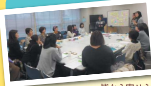
皆から寄せられた課題に、アイデアを出し合いました

異業種の女性起業家が多数参加。スタッフが自身の事業をプレゼンする「おはなし会」とワークショップを実施しました。回を重ねるごとに情報共有だけでなく連携の可能性を探るなど、親睦を深めつつ次の目標を見つけていきました。