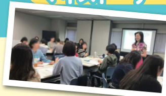
自分の働き方生き方と真剣に向き合った2時間でした。