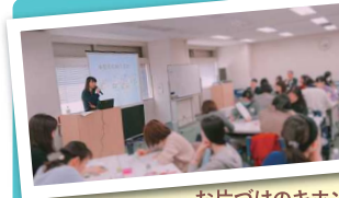
お片づけのキホンに熱心に聴き入る受講者たち

新学期が待ち遠しくなる「ママが笑顔になれるお片づけ講座」を開催。ワークライフバランスを整えるために何を優先するのか、という視点に、気づきの多い講座でした。参加者からは「今日からできそうなアドバイスがあってすぐに実践できそう」との声が寄せられました。