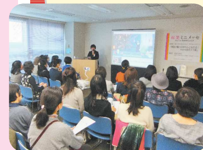
人気通販サイト「minne」流の写真撮影術を学ぶ講座。定員の2倍を超える応募があり大盛況。

11月25日(土)・26日(日) 「起業ミニメッセ2017in世田谷らぶらす」を開催しました。