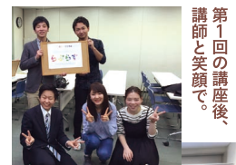
第1回の講座後、講師と笑顔で。第4回講師の皆さん

世田谷で活動する3つのLGBT支援団体(NPO法人ReBit、NPO法人レインボーコミュニティ colLabo <コラボ>、NPO法人共生