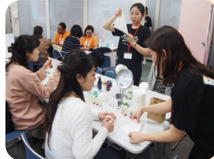
ビューティコーナーでは就活に役立つメイクやスキンケアを体験