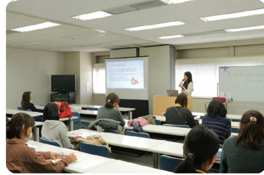
シングルマザーのための講座を開催