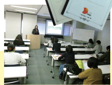
熱心に話を聞く女性起業家たち