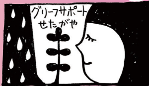
死別を体験した子どもや大人が集い、遊びやおしゃべりを通して、自分の気持ちと向き合うことのできる家「サボコハウス」を運営しています。

らぶらす区民企画協働事業は、団体結成の初期に行った事業です。グリーフという言葉は一般的に馴染みがないため、公的な機関であるらぶらすと協働できたことは、参加者の安心感を高めるうえで、ありがたかったです。講座は満員で、アンケートからもグリーフサポートの必要性を再確認できました。今は民間の助成金などを受けて講座を開いたり、大切な人を亡くした子どもや大人の集いを太子堂に借りた家「サボコハウス」で行なっています。