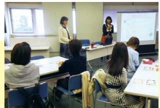
色を通して自分についての考えのクセや行動の偏りに気づく。

色が持っている意味や力を使って、これまでの人生を振り返り、これからの生き方やキャリアを考える講座。ワークや参加者同士の交流を通じて自分を知り、これからのライフ・キャリアプランを「自分色」で描くためのヒントを学びました。参加者は色鉛筆を手に、自分の人生をさまざまな色で表現していました。選んだ色に、自分でも意識していなかった感情や性格が表れていることを知り、驚く表情が印象的でした。