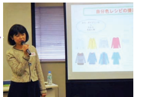
気分を変えよう、上げよう! 色のパワーを味方にするヒント