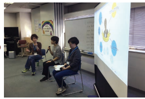
ゲストを迎えるトーク