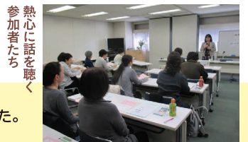
熱心に話を聴く参加者たち