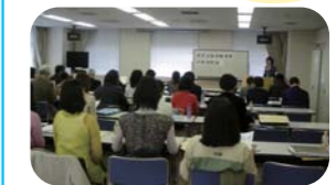
平成26年度区民企画協働事業応募説明会