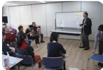
合流後、なごやかに話らうママとパパたち

(社福) 子どもの虐待防止センター (=CCAP) では、育児に関する不安・疑問・悩みを共有し、夫婦と一緒に育児を楽しむためのしゃべり場を開催しました。前半は父親と母親別々のグループで、後半は合流して話し合ったことを発表。父親からは仕事などの制約があり思うように育児に関われない悩み、母親からは育児中の孤立感などが出され、面と向かっては話せない双方のホンネが飛び出しました。まとめでは、講師が自身の育児体験も交え、「お互い大変なんだよね、だから、一緒に考えてほしい」と伝えました。