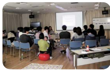
お話とワークが組み合わされた楽しくするための講座

(特非) マドレボニーータは出産前後の女性の心と体のヘルスケアプログラムの開発・実践・研究を行っています。妊娠中・産前・産後、または子どもを持つ予定のある女性とそのパートナーを対象に、夫婦で仲良く子育てをするために知っておきたいさまざまなポイントについて、カップルで学ぶ講座を開催しました。ペアでのコミュニケーションワークなども行い、2人で楽しみながら子育てをするコツを学ぶ機会となりました。