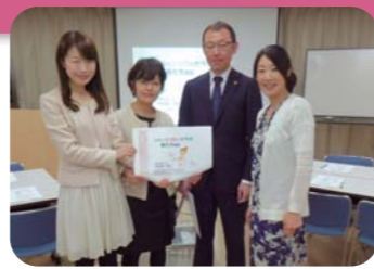
女性の健康や法律の知識、お互いの経験をシェアしました。

えるお金のことをトータルに伝えたい」という思いから、区民企画協働事業に応募。女性がライフイベントを諦めず自分らしく前向きに取り組めるように、健康や法律面からサポートをするという新しい視点で講座を行いました。