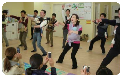
パパたちのポーズ、決まってる!

父親の育児を応援するため、らぶらすではパパと子どもが楽しく遊ぶ「しもきたパパ・バギーの日」を実施しています。らぶらすは、父親が主体的に育児に取り組むことで、「子どもの世話は女性の役割」とする固定的性別役割分担意識を変えていくことにつながると考えています。