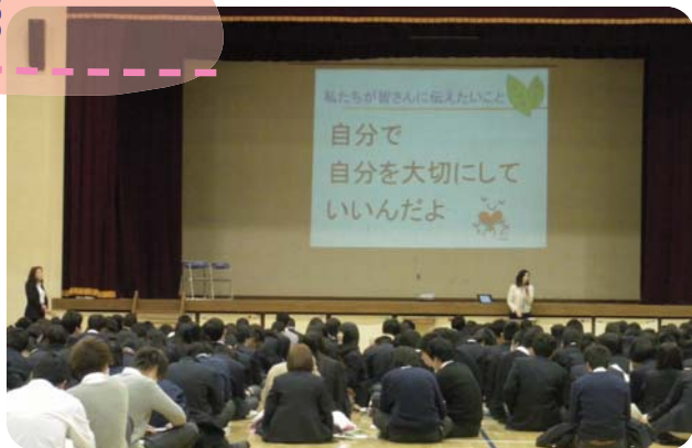
デートDV防止で大切なことは? 自分を大切にすることだよ

講座のテーマは、デートDVの防止、セクシュアルマイノリティ理解、理系キャリアのすすめなど。なかでもデートDV防止講座を希望する学校が増えており、若者にとってデートDVが深刻な問題であると認識されていることがわかります。