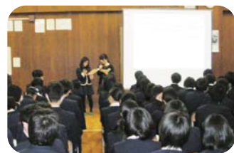
大学生がデートDVについて語る

平成26年3月には、「デートDV防止ファシリテーター養成講座」を修了した大学生が、講座の中でデートDVについて伝える寸劇を演じ、最後に「大切にするとなんだろう」をテーマに中学生へ語りかけました。大学生という身近な先輩の言葉に、生徒たちは熱心に聞き入っていました。