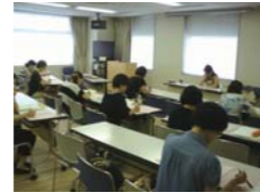
シングルマザーのための 就労応援講座