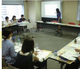
講師がプレゼンテーションについてレクチャー

「売りたい」を「売れる」商品に仕立てるために、マーケティングを中心に学ぶ連続講座を開催。最終回では受講者全員が、商品のプレゼンテーションを行いました。