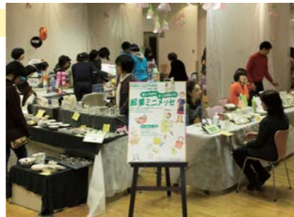
2000人以上の来場者でにぎわうフロア

世田谷で起業した女性たちが大集合するわくわくワークフェスタが、三軒茶屋キャロットタワー4階・5階で2日間にわたり開催されました。4階の起業ミニメッセでは、カフェ・フード、手芸品、ファッション・グッズなどの販売、まちづくりや子育てなど地域を暮らしよくするための活動紹介など、58もの起業家が出展し、終日、元気な女性たちの声でにぎわいました。