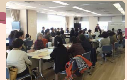
世田谷区で活動するグループ・団体が集合!

10月27日(日)第2回らぶらすフェスタを開 催しました。今年度は区民の企画による4つ の講座を加え、地域の課題解決に向けて区 内の団体・グループとの連携・交流を深め ました。「地域活動できりり☆」というテーマ