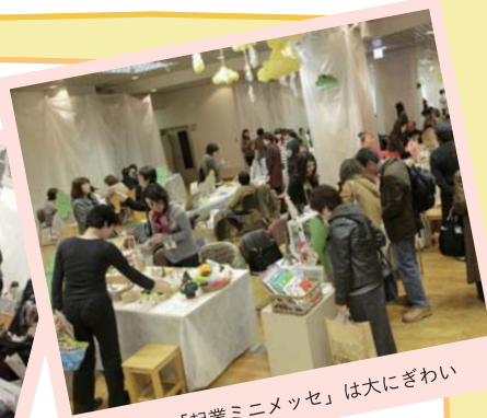
毎年、「起業ミニメッセ」は大にざわい