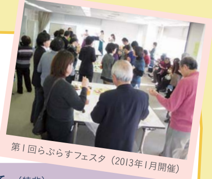
第1回らぶらすフェスタ (2013年1月開催)