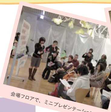
会場フロアで、ミニプレゼンテーション