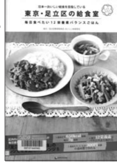
「足立区の給食室」製作委員会(2011) 『日本一おいしい給食を目指している 東京・足立区の給食室』 アーススター 596二