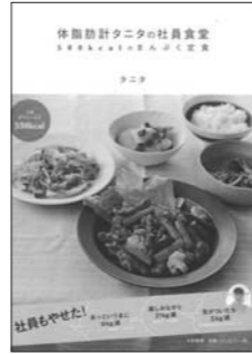
タニタ(2010) 『体脂肪計タニタの社員食堂』 大和書房 596夕