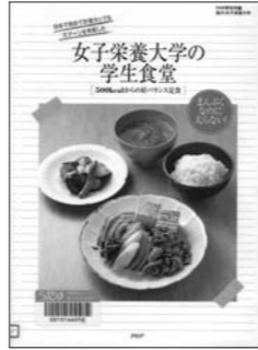
PHP研究所(2011) 『女子栄養大学の学生食堂』 PHP研究所 596ジ

食について専門的に学ぶ大学、体脂肪計を販売している企業、給食に力を入れる自治体…。毎日の食と健康について、専門的な立場で行われている取り組みの成果が、家庭でも使えるレシピになりました。