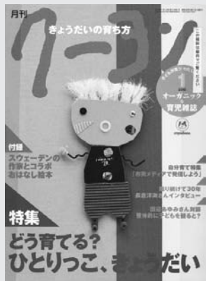
クレーンハウス『月刊クレーン』