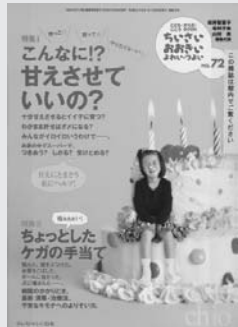
小学館『edu』 『ちいさい・おおきい・よわい・つよい』

子育てに役立つアイデア満載の雑誌が、新たにらぶらすの資料に加わりました。ちょっとした息抜きにも、おススメです。