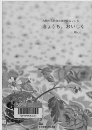
Rico(2005) 『きょうも、おいしく』 女子栄養大学出版部(494.6リ)

著者自身のがんの体験を踏まえて、ダメージを受けた身体と上手に付き合っていくためのヒントをくれる本です。