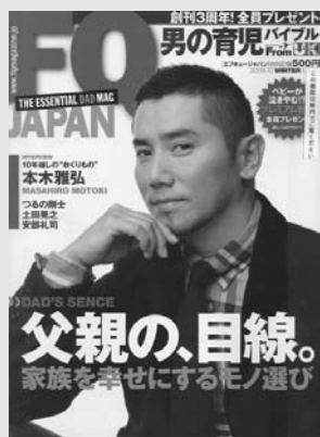
アクセスインターナショナル『FQジャパン』