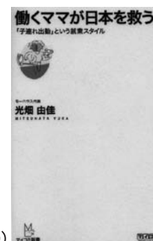
光畑由佳(2009) 『働くママが日本を救う!』 毎日コミュニケーションズ(366.3ミ)