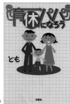
とも(2009) 『育休パパになろう』 文芸社(599.0ト)