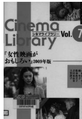
小藤田千栄子ほか(2009) 『女性映画が面白い 2009年版』 バド・ウィメンズ・オフィス (778.2ジ)