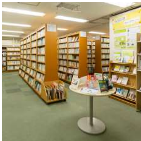
らぶらすライブラリー