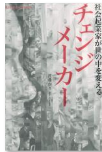
『チェンジメーカー 社会起業家が世の中を変える』 渡邊 奈々 著 日経BP社