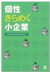
『個性きらめく小企業』 日本政策金融公庫総合研究所 編