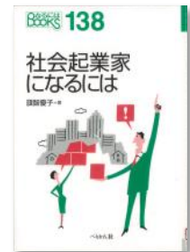
『社会起業家になるには』 旗智 優子 著 ペリかん社