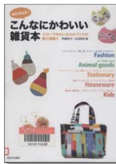
『福祉施設発!こんなにかわいい雑貨本』 伊藤幸子・太田明日香 著 西日本出版社