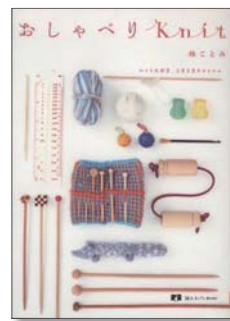
『おしゃべりKnit』 林こども 著 グラフィック社