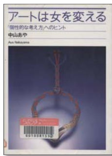
『アートは女を変える』 中山あや 著 はまの出版