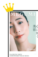
MEGUMIさんの新刊は、らぷらすで借りられます！

情報誌『らぷらす』は年2回発行。次号は12月に発行する予定！バックナンバーは、らぷらすのHPからダウンロードできます。