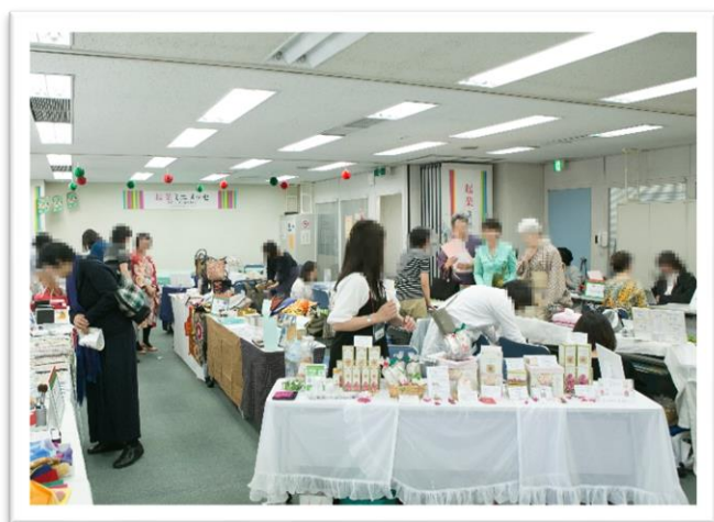
平成30年 らぷらすで開催の様子