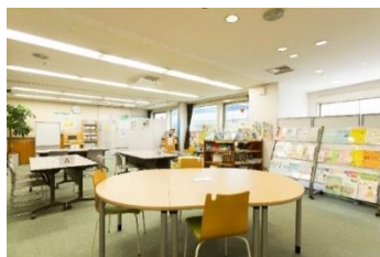
【情報・交流コーナー】

【らぷらすの施設】みなさまの活動の拠点に、打合せスペースに。どんどん活用してください!!