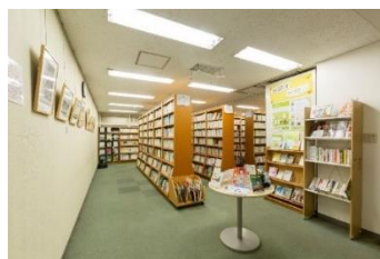
【ギャラリー・ライブラリー】