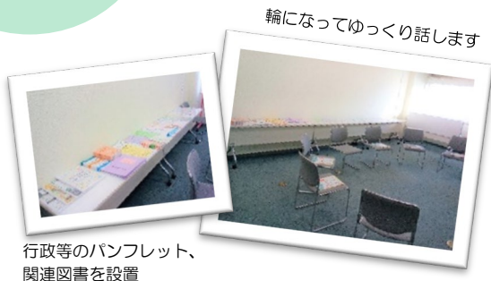
行政等のパンフレット、 関連図書を設置