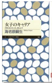
『女子のキャリアー(男社会)のしくみ、教えます』 海老原嗣生 著 ちくまプリマー新書