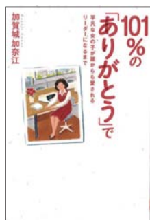
『101%の「ありがとう」で平凡な女の子が誰からも愛されるリーダーになるまで』 加賀城加奈江 著 幻冬舎ルネッサンス