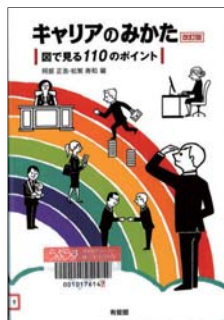
『キャリアのみかた一図で見る110のポイント』 阿部正浩・松繁寿和 編 有斐閣