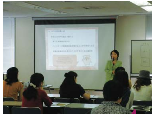
9月開催の講座「どう働く? 103万円の壁」

自分の働き方を考えることは、自分を見つめ直したり自分を知ることにつながります。そこから社会に関心を持ったり、社会をもっと知りたくなったり…。自分の働き方をデザインしていくというのは、分析と選択、そして行動の相互作用のようなものなのかもしれません。今号ではあなたの働き方のヒントになりそうな図書をいろいろ集めてみました。ピンときたものからぜひ手に取ってみてください。