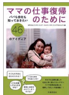
『ママの仕事復帰のために』 NPO法人ファザーリング・ジャパン マザーリングプロジェクト 著 労働調査会